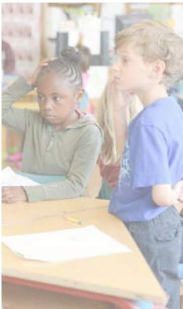
ESCUELAS COMUNITARIAS DE CALIDAD

Mediremos la efectividad de los servicios centrales para asegurar que las necesidades de estudiantes son primera prioridad y que las escuelas reciban el apoyo que necesitan para tener éxito. Participaremos en ciclos de investigación para elevar los servicios ejemplares y para mejorar nuestros apoyos a las partes interesadas.