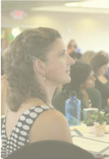
DISTRITO ESCOLAR RESPONSABLE

Crearemos oportunidades de desarrollo profesional que faciliten el desarrollo de todos los empleados como educadores y líderes en nuestro sistema de manera que apoye la asignación y retención de nuestros empleados efectivos.