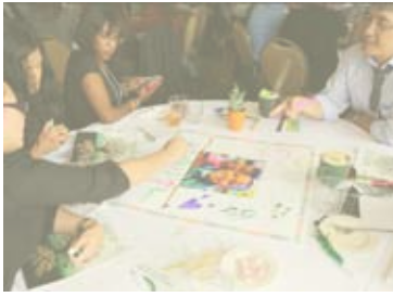
PROGRAMAS EFECTIVOS DE TALENTO