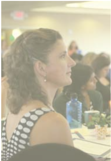
សង្កាត់សាលារៀនដែលមានទទួលខុសត្រូវ

យើងនឹងបង្កើតឱកាសរីកចម្រើនប្រកបដោយវិជ្ជាជីវៈ ដែលជួយដល់ការបណ្តុះបណ្តាលនិយោជិកក្នុងនាមជាអ្នកអប់រំ និងជាមេដឹកនាំ នៅក្នុងប្រព័ន្ធរបស់យើង ក្នុងលក្ខណៈមួយដែលជួយទ្រទ្រង់ដល់ការរកការងារឱ្យនិយោជិកដ៏មានប្រសិទ្ធភាព និងការរក្សាទុកពួកគេឱ្យបានគង់វង្ស។