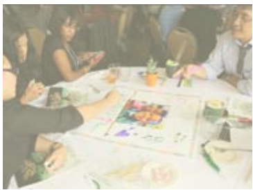
កម្មវិធីសំរាប់អ្នកមានទេពកោសល្យជាក់ស្តែង