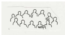
家庭小組會議 社區會議